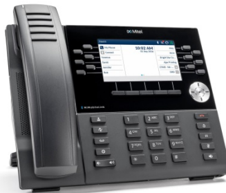
MiVOICE 6930 IP PHONE