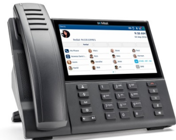
MiVOICE 6940 IP PHONE