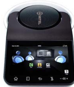
MiVOICE CONFERENCE PHONE