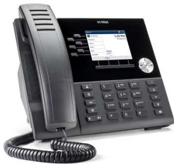
MiVOICE 6920 IP PHONE